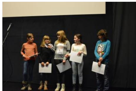
Nagrajenke na zaključni slovesnosti v Kinoteki

na to temo posnelo 18 filmčkov, pri čemer jim je pomagalo 14 mentorjev. Vse filmčke so si lahko v času trajanja festivala "Film proti korupciji" na računalnikih v preddverju ogledali obiskovalci Slovenske kinoteke, v pripravi pa je tudi spletno mesto natečaja, kjer bodo vsi filmčki trajno na voljo za ogled. Do tedaj si lahko filmčke ogledate tukaj .