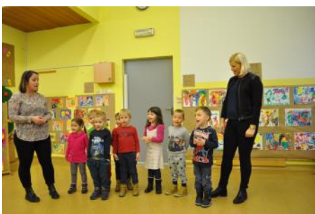
Kulturni program ob zaključnem dogodku v Vzgojno varstvenem zavodu Slovenj Gradec - vrtec Maistrova.

Tak ustvarjalni natečaj smo kot pilotni projekt izvedli že leta 2014 z Vrtci Občine Žalec, z naslovom »Korupcija ali poštenost?«, odlični odzivi in številni izdelki pa so nas spodbudili, da smo letos k projektu povabili vse slovenskih vrtce. Odzvalo se je šest vrtcev oziroma skupin vrtcev, Vrtec Ivana Glinška Maribor – enota Smetanova, Vzgojno varstveni zavod Slovenj Gradec – enote Maistrova, Podgrad in Šmartno, Vrtci občine Žalec in Vrtec La Coccinella Piran pa so projekt izvedli še pred zaključkom letošnjega leta, in s tem omogočili izpeljavo zaključnih dogodkov na lokacijah vrtcev v okviru aktivnosti mednarodnega dneva boja proti korupciji. Projekt naj bi izvedli v prvi polovici prihodnjega leta še v vrtcu Pedenped v Ljubljani ter vrtcu Ciciban Novo Mesto.