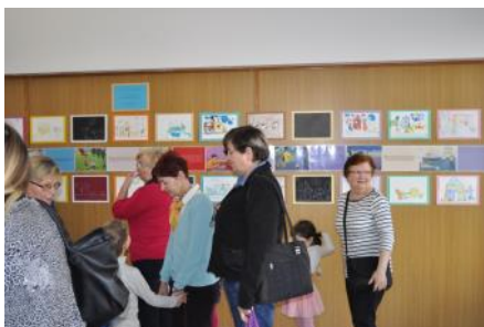
Zaključni dogodek v vrtcu Ivana Glinška v Mariboru

natečaju »Spoznavanje integritete skozi sliko in igro«, več o obeh natečajih pa si lahko preberete v tej številki Vestnika.