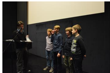
Nagrajenci na zaključni slovesnosti v Kinoteki

Po zaključku natečaja letošnjega oktobra je filmčke pregledala tričlanska natečajna komisija in izmed njih izbrala tri zmagovalne filmčke (OŠ Bizeljsko – film brez naslova, OŠ Gornja Radgona – »Igra odraslih«, in OŠ Grad – »OŠ Grad ima talent«) in še dva (OŠ narodnega heroja Rajka – filma »Korupcija v razredu« ter »Podkupljeno tekmovanje«), ki sta si zaslužila posebno omembo. Avtorji izbranih filmčkov bodo lahko za nagrado na eni od sodelujočih slovenskih srednjih šol z medijskim programom - Srednji medijski in grafični šoli Ljubljana, Srednji šoli za oblikovanje Maribor, Ekonomski šoli Novo mesto in Ekonomski gimnaziji in srednji šoli Radovljica - svoj filmček profesionalno posneli z dijaki in mentorji medijskih programov. Na tak način bo komisija k osveščanju o korupcijskih temah pritegnila tudi srednješolce in njihove učitelje.