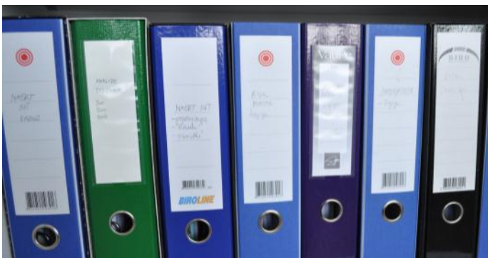
Gradivo za pripravo načrtov integritete.

Komisija je na podlagi 58 pregledanih načrtov integritete upravnih enot in 82 načrtov integritete samoupravnih lokalnih skupnosti (občin) ugotovila, da so javni uslužbenci, ki neposredno opravljajo naloge oziroma izvajajo pristojnosti na področju okolja in prostora, to področje izpostavili kot izrazito tvegano za pojav korupcije in navedli precej dejavnikov, ki ta tveganja ohranjajo ali drugače – vzdržujejo »pri življenju«. Velik del dejavnikov tveganj izhaja iz normativne neurejenosti tega področja kot tudi iz neurejenosti procesov dela, prek katerih se vršijo postopki priprav in odločanja o okoljskih oziroma prostorskih zadevah.