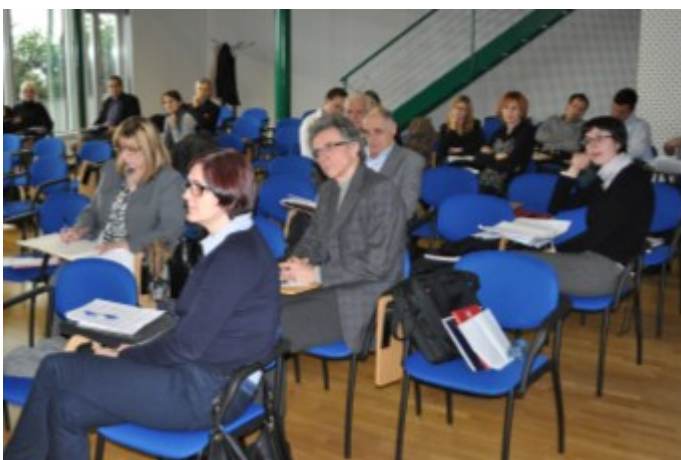
Udeleženci med delavnico o lobiranju

Komisija je v sodelovanju s Skupnostjo občin Slovenije organizirala seminar z delavnico »Pravila lobiranja na lokalni ravni«. InSTITUTE ZIntPK, še posebej tiste, ki so pomembni za delovanje lokalnih skupnosti, so udeležencem predstavili strokovnjaki s posameznih področij dela komisije. Praktični del seminarja je bil izveden v obliki delavnice, v kateri so sodelujoči na konkretnih primerih poglobljali svoje znanje s področja lobiranja.