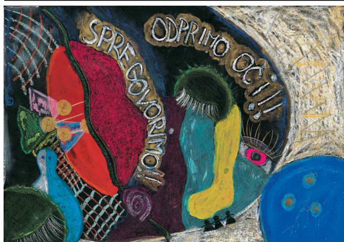
Eva Lupše, I. OŠ Žalec, Žalec

»Odprimo oči! Spregovorimo! Odprimo oči, spregovorimo o težavah in jih rešimo. Pomembno je težave rešiti, predvsem sproti, ne o njih samo debatirati ...«